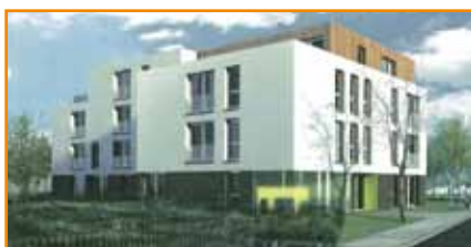
LOT 8a Programme : 23 logements collectifs en accession. LIVRÉ EN JANVIER 2012