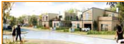
LOT 5 Programme : 44 logements collectifs et 33 maisons individuelles en accession libre et accession sociale INDIVIDUELLES LIVRÉES AU PREMIER SEMESTRE 2012.