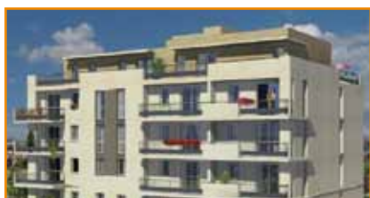
LOT 7b Programme : 21 logements collectifs en accession aidée. LIVRÉ FIN 2013