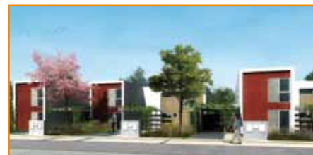
LOTS 8e et 9b Programme : 19 logements collectifs et 15 maisons individuelles en locatif social, 13 logements individuels en accession. LIVRÉ MI 2013

+ d'infos au 03 22 22 37 50 www.amiens-amenagement.fr