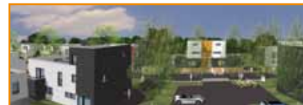
LOT 6 Programme : 20 maisons individuelles et 30 logements intermédiaires en accession LIVRÉ MI-2013