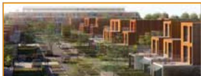
LOT 3 Programme : 49 logements collectifs et 20 logements intermédiaires en accession LIVRÉ EN MARS/AVRIL 2012 Programme : 32 logements intermédiaires en locatif social LIVRÉ EN MARS/AVRIL 2012