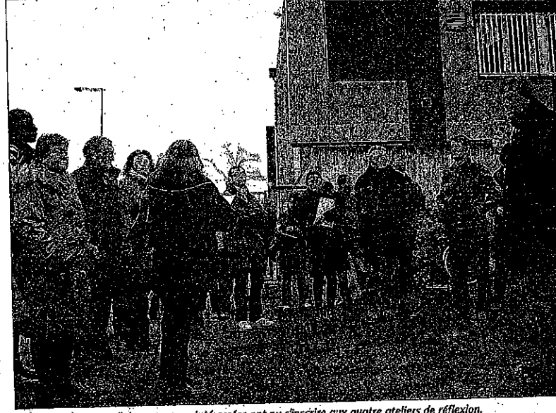
Après la visite, samedi, les personnes intéressées ont pu s'inscrire aux quatre ateliers de réflexion.

Si les activités actuelles seront relocalisées ailleurs d'ici 2011, l'entreprise gardera deux bâtiments sur le site. Le bâtiment Racine, situé côté avenue du 14-Juillet-1789, et le bâtiment Mermoz, côté avenue Paul-Claudiel. « Ils abritent des terminaux téléphoniques stratégiques pour la ville. Une des contraintes de l'aménagement futur sera d'ailleurs de ne pas toucher un réseau de câbles sous la voirie et qui relient les deux bâtiments ».